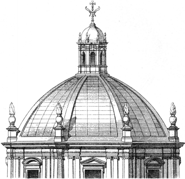
Von der Kirche San Lorenzo zu Mailand 105 ).