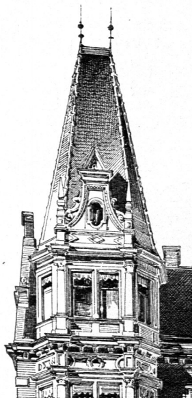
Vom Wohnhaus Hayler zu München 87) .