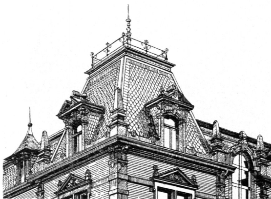
Von einem Wohnhaus zu Landau 86) .