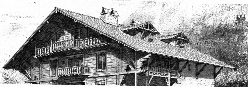
Von einem Wohnhaus zu Chamounix 20) .