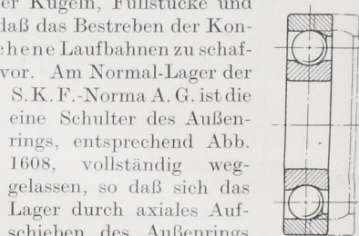
Abb. 1609. Schluß eines Kugellagers durch elastische Erweiterung oder Anwärmen des Außenrings.

S. K. F.-Norma A. G. ist die eine Schulter des Außenrings, entsprechend Abb. 1608, vollständig weggelassen, so daß sich das Lager durch axiales Aufschieben des Außenrings über die im Innenring sitzenden Kugeln zusammensetzen läßt. Axialdrucke können dann nur in einer Richtung oder durch symmetrische Anordnung zweier Lager aufgenom-