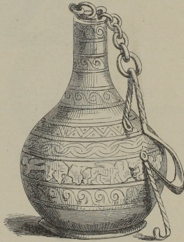
Flasche aus getr. Bronze. (Hetr.)

Später wird diese Form nur noch im Kleinen ausgeführt, besonders für Salbgefäße, die in ihrer edelsten Ausbildung als attische Lekythoi jedoch mehr an den Schlauch als an die Flasche erinnern. Andere bereits besprochene Salbflaschen, besonders in edlen Steinen und in Glas,