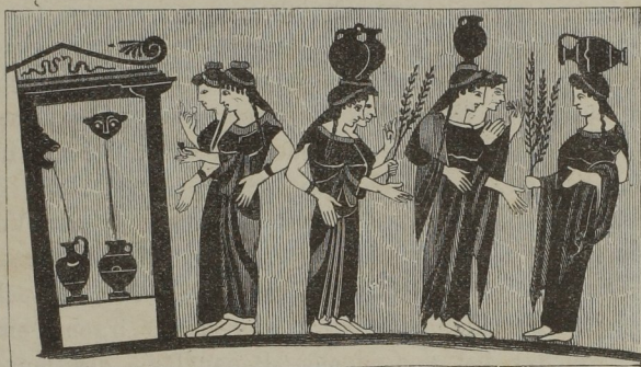
Tragen der Hydria.

Wie bedeutsam tritt das schwebende geistige und klare Wesen der quellverehrenden Hellenen schon aus dieser untergeordneten Kunstgestaltung symbolisch heraus, gegenüber der Situla, bei welcher das physische Gesetz der Schwere und des Gleichgewichts einen ganz entgegengesetzten, aber dem Geiste des ägyptischen Volks nicht minder entsprechenden, Ausdruck fand!