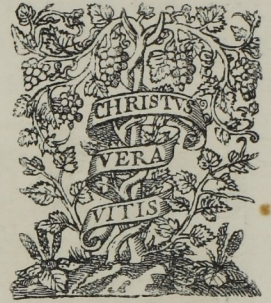
Fig. 413. — Marque de Plantin, imprimeur à Anvers (1557).

La plupart des éditions primitives se ressemblaient, parce qu'elles étaient imprimées généralement en lettres gothiques ou lettres de somme , caractères hérissés de pointes et d'appendices anguleux. Ces caractères, quand