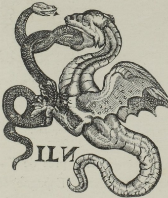
Fig. 414. — Marque de J. Le Noble, libraire à Troyes (1595).

La plupart des éditions primitives se ressemblaient, parce qu'elles étaient imprimées généralement en lettres gothiques ou lettres de somme , caractères hérissés de pointes et d'appendices anguleux. Ces caractères, quand