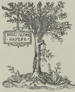
Fig. 411. — Marque de Robert Estienne, imprimeur à Paris (1536).

estimé cent vingt-cinq écus, et quelques années plus tard, le Tite-Live , imprimé à Rome par Sweynheim et Pannartz, en un volume in-folio sur vélin, ne valait plus que cinq écus d'or.