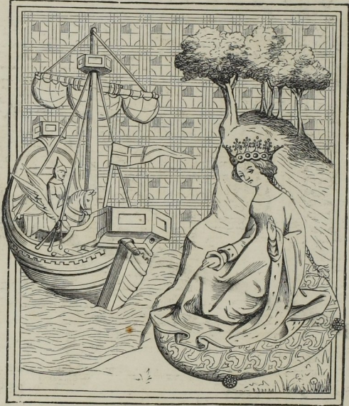
Fig. 370. — Miniature extraite des Femmes illustres traduites de Boccace. (Bibl. imp. de Paris.)

Heures de Jean, duc de Berry (fig. 372), et les Miracles de Notre-Dame .