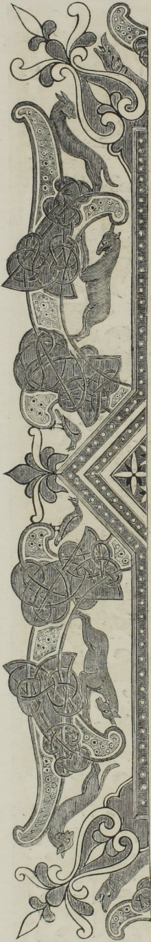
Fig. 359. — Bordure tirée d'un Évangélaire latin, exécuté en Angleterre (dixième siècle).

A vrai dire, s'il y avait chez nous décadence, les artistes anglo-saxons et visigothiques de cette époque n'offraient rien d'enviable, à en juger d'après un Évangélaire latin peint en Angleterre au dixième siècle (fig. 359) : ce manuscrit démontre pourtant que l'art d'ornementer les livres était moins dégénéré que celui de dessiner les figures humaines. Un autre manuscrit, avec peintures dites visigothiques, contenant l' Apocalypse de saint Jean , nous donne, par ses ornements et ses animaux fantastiques, un exemple du style étrange qu'avait adopté une certaine école de miniaturistes indigènes.