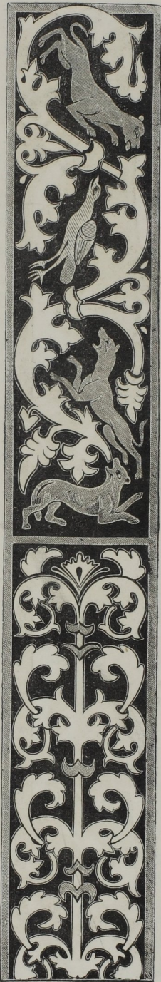
Fig. 358. — Bordure tirée de la Bible de Saint-Martial de Limoges (dixième siècle).

en France, et conservés dans la même collection, témoignent, par la roideur et l'incorrection du dessin, que l'élan excité par le génie de Charlemagne s'était ralenti : ce sont la Bible de Noailles , et la Bible de Saint-Martial de Limoges (fig. 358).