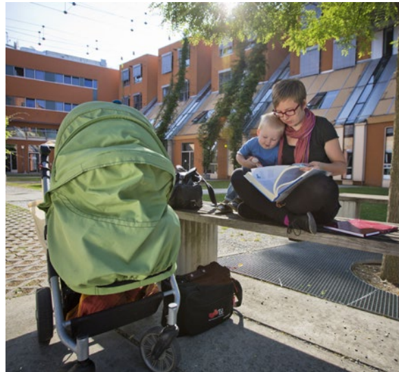
Die Sommermonate schön gestalten.

Auch wenn wir uns jetzt noch in Woldecken kuscheln oder uns an Wintersportaktivitäten erfreuen – viele Eltern und obsorgepflichtige Personen denken schon jetzt an die neun Wochen dauernden Sommerferien und wie der Nachwuchs gut betreut die freie Zeit in vollen Zügen genießen kann. Die nanoversity hat mit der Fleki-Sommerbetreuung ein hochwertiges Betreuungsangebot für die Kinder von TU Graz-Angehörigen parat. Auf dem Programm stehen Experimentiertage, Ausflüge und lustige