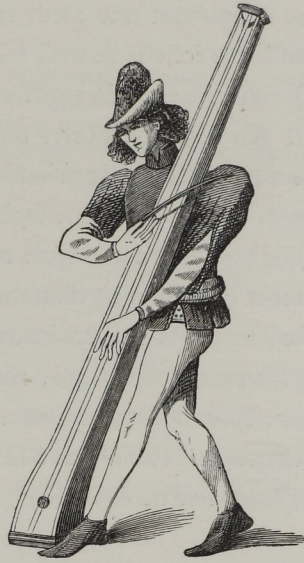
Fig. 201. — Long monocorde à archet, quinzième siècle. (Ms. de Froissart, à la Bibl. imp. de Paris.)

gigue avait trois cordes (fig. 199); elle différait surtout de la viole en cela que le manche, au lieu d'être dégagé et comme indépendant du corps de l'instrument, n'en était en quelque sorte qu'un prolongement sonore. La gigue, qui ressemblait beaucoup à la mandoline moderne, et sur laquelle les Allemands faisaient merveilles, au dire du trouvère Adenès, qui parle avec admiration des gigueours d'Allemagne , la gigue disparut totalement, du moins en France, au quinzième siècle; mais son nom resta pour désigner une danse joyeuse qui s'était longtemps exécutée au son de cet instrument.