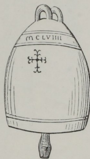
Fig. 175. — Cloche d'une tour de Sienne, douzième siècle.

s'attachait aux genoux ou aux pieds pour les agiter en gesticulant. Les petites cymbales ou crotales étaient des espèces de grelots, que les danseurs faisaient sonner en dansant, comme les castagnettes espagnoles, qui, en France, au seizième siècle, s'appelaient maronnettes , et qui avaient été auparavant les cliquettes des ladres ou lépreux. Les grelots proprement dits devinrent tellement en vogue à une certaine époque, que, non-seulement on en garnissait les harnais de chevaux, mais encore les habits des hommes et des femmes, qui, au moindre mouvement, tintaient, résonnaient comme autant de carillons ambulants.