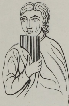
Fig. 159. — Syrinx à sept tuyaux, neuvième ou dixième siècle. (Ms. d'Angers.)

ments que lui donnèrent les Allemands, d'être en vogue au seizième siècle, et même de recevoir le nom de flûte allemande (fig. 160).