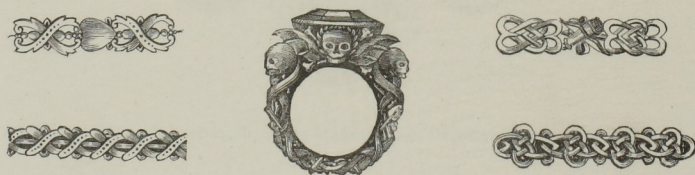
Fig. 132 à 136. — Bagues.

Bien avant que François I er eût appelé à sa cour Benvenuto Cellini et quelques bons orfèvres italiens, les orfèvres français avaient prouvé qu'ils ne demandaient qu'un peu d'encouragement pour se placer d'eux-mêmes à la hauteur des artistes étrangers. Mais, cette faveur leur manquant, ils allaient