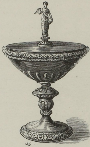
Fig. 105. — Coupe en lapis-lazuli montée en or, enrichie de rubis et d'une figurine en or émaillé. Travail italien du seizième siècle.)

L'inventaire de la vaisselle et des bijoux d'Henri II, parmi lesquels il y en avait beaucoup de Benvenuto Cellini, cet inventaire, dressé à Fontainebleau en 1560, nous montre qu'après le départ de l'artiste florentin, les orfèvres français étaient restés dignes de cet éloge; et pour avoir une idée de ce