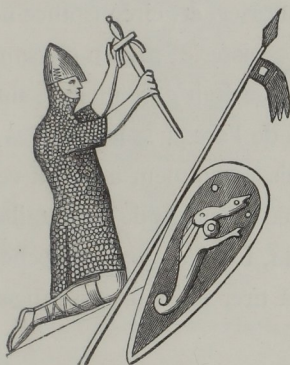
Fig. 47. — Le roi Guillaume, ainsi représenté sur son sceau, conservé en Angleterre.

Le costume présente peu de variété; on n'y remarque que deux sortes d'habillements : l'un, fort simple, porté par des gens qui n'ont pas de casque,