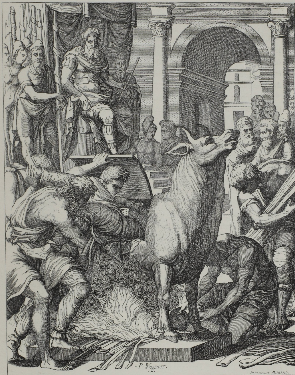
Fig. 270. — Phalaris, tyran d'Agrigente, faisant enfermer dans un taureau d'airain des victimes destinées à être brûlées vives et dont les cris reproduisaient les mugissements d'un taureau. Gravé par P. Woeriot. (École française du seizième siècle.)