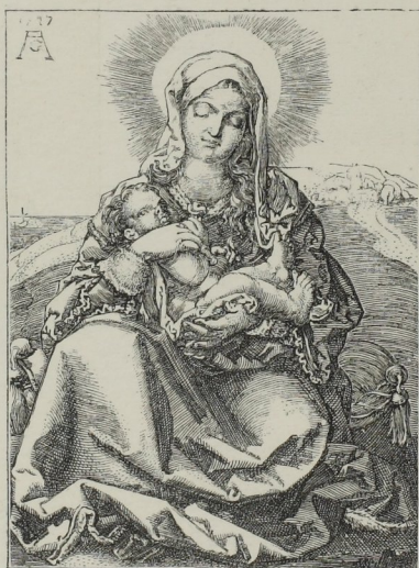
Fig. 274. — La Sainte Vierge, gravée par Aldegrever en 1527.

le Véronèse; on doit au Hollandais Corneille Visscher le fameux Vendeur de mort aux rats , et à Étienne de la Bella, Florentin, la Vue du Pont-Neuf de Paris. Le prince Palatin Robert (neveu de Charles I er d'Angleterre) fut l'inventeur de la mezza-tinte ou manière noire; Guillaume Faithorne, Anglais, grava plusieurs portraits d'après van Dyk. La France nous présente aussi des noms justement célèbres : les vues de villes d'Israël Silvestre, de Nancy, sont très-recherchées; François de Poilly, d'Abbeville, a reproduit quelques tableaux de Raphaël; Jean Pesne, de Rouen, peintre lui-même, grava surtout d'après Poussin; Antoine Masson, d'Orléans, a légué à la postérité une gravure des Pèlerins d'Emmaüs , d'après le tableau du Titien, laquelle est regardée comme un chef-d'œuvre; enfin Robert de Nanteuil, de Reims, le fameux portraitiste, grava quatre fois Péréfixe, archevêque de Paris, cinq fois l'archevêque de Reims, six fois Colbert, dix fois le ministre Michel Le Tellier, onze fois Louis XIV, et quatorze fois le cardinal Mazarin.