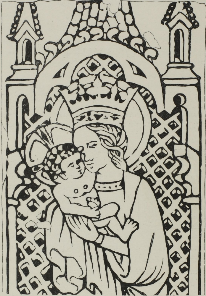
Fig. 261. — La Vierge et l'enfant Jésus, fac-simile d'une gravure sur bois du quinzième siècle. (Bibl. imp. de Paris. Cab. des estampes.)

Quoi qu'il en soit, certains auteurs regardent la gravure sur bois comme ayant été inventée en Allemagne, au commencement du quinzième siècle.