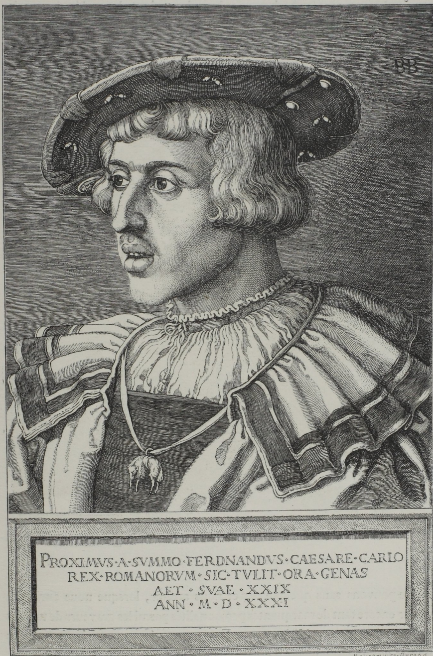
Fig. 271. — Ferdinand 1 er , frère de Charles-Quint, gravé par Barthélemy Behaim en 1531.