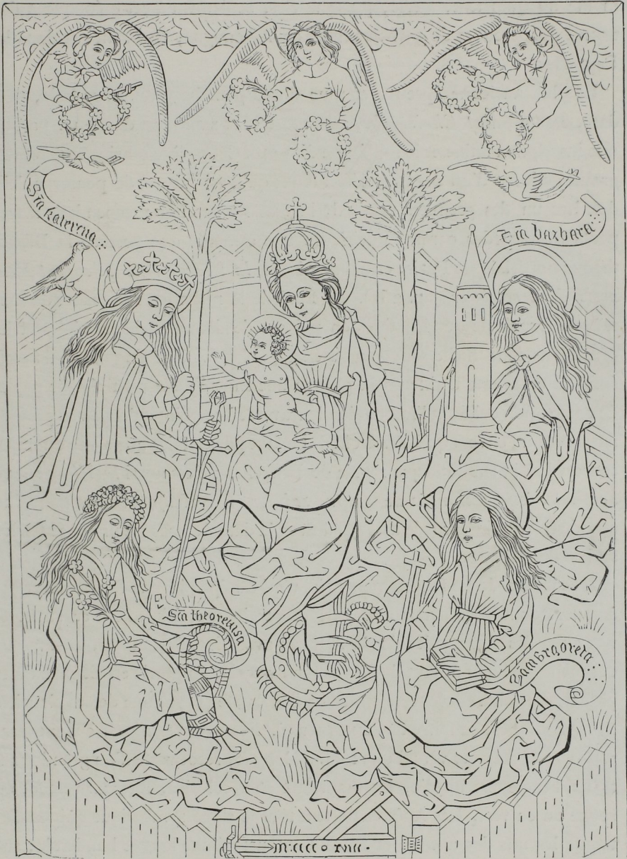
Fig. 262. — La Vierge à l'enfant, gravure sur bois du quinzième siècle. (Bibl. royale de Bruxelles.)

occuper en Europe. Ces hypothèses étant admises, toute la question se réduirait à chercher par quelle voie cet art pénétra en Occident, dans la première