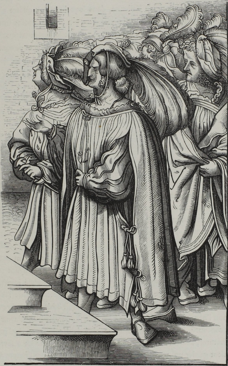
Fig. 264. — Les Archiducs et les hauts barons d'Allemagne assistant, en grand costume de cérémonie, au sacre de l'empereur Maximilien. Fragment tiré du grand recueil d'estampes intitulé le Triomphe de Maximilien I er , par J. Burgkmair (seizième siècle).