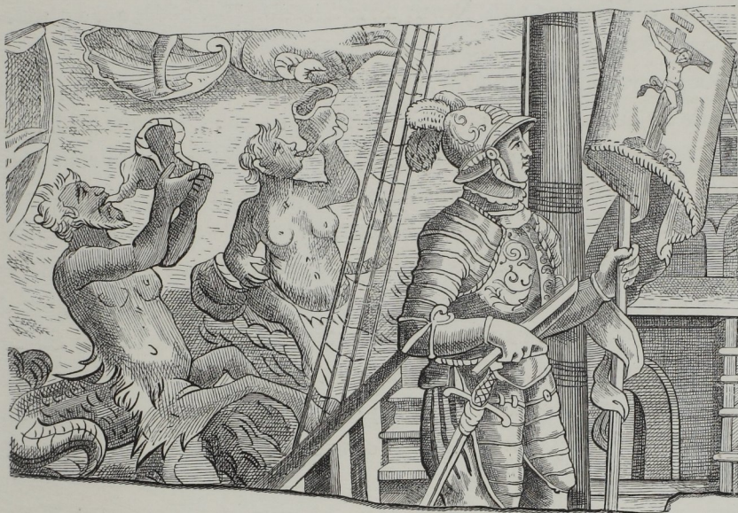
Fig. 266. — Fac-simile d'un nielle, exécuté sur ivoire, d'après le dessin original de Stradan, représentant Christophe Colomb sur sa caravelle, pendant son premier voyage aux terres occidentales. (Bibliothèque Laurentienne de Florence.)

A l'appui de l'opinion, indirectement émise plus haut, que la pratique du tirage des estampes à l'aide de planches de métal burinées pourrait bien être, en quelque sorte, le résultat fortuit d'une simple tradition professionnelle de l'orfèvrerie, nous devons remarquer que la plupart des estampes que nous a