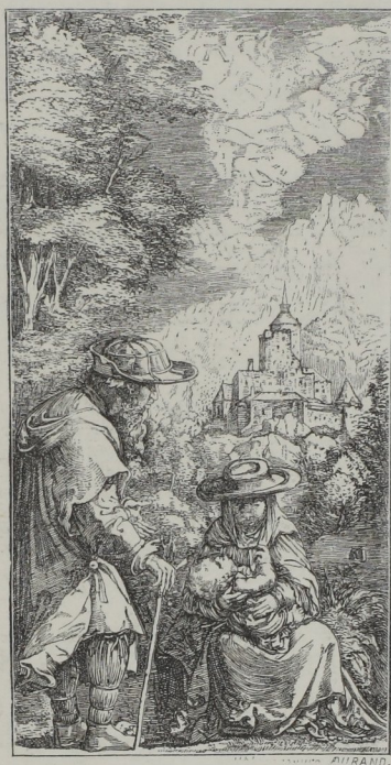
Fig. 273. — Repos de la sainte Famille, gravé par A. Altdorfer.

Nommer ces artistes au seuil d'une époque où nous ne pouvons les suivre, doit suffire à donner une idée du niveau auquel l'art sut se tenir pendant ce siècle. Cependant citons encore, à leur suite, quelques noms parmi les graveurs étrangers : les Flamands Nicolas Berghen et Paul Potter, tous deux grands peintres d'animaux, ont laissé des eaux-fortes que se disputent les amateurs; l'Anglais Wenceslas Hollar grava la Reine de Saba , d'après