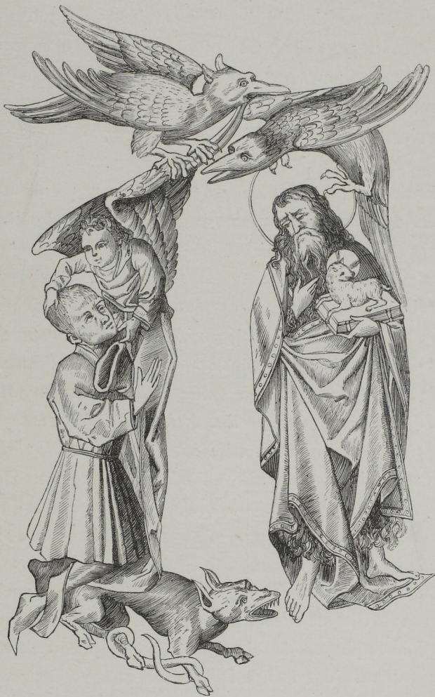
Fig. 267. — Fac-simile de la lettre N de l' Alphabet grotesque , gravé par le Maître de 1466 .

Nous avons encore à nommer trois graveurs, relativement célèbres, avant