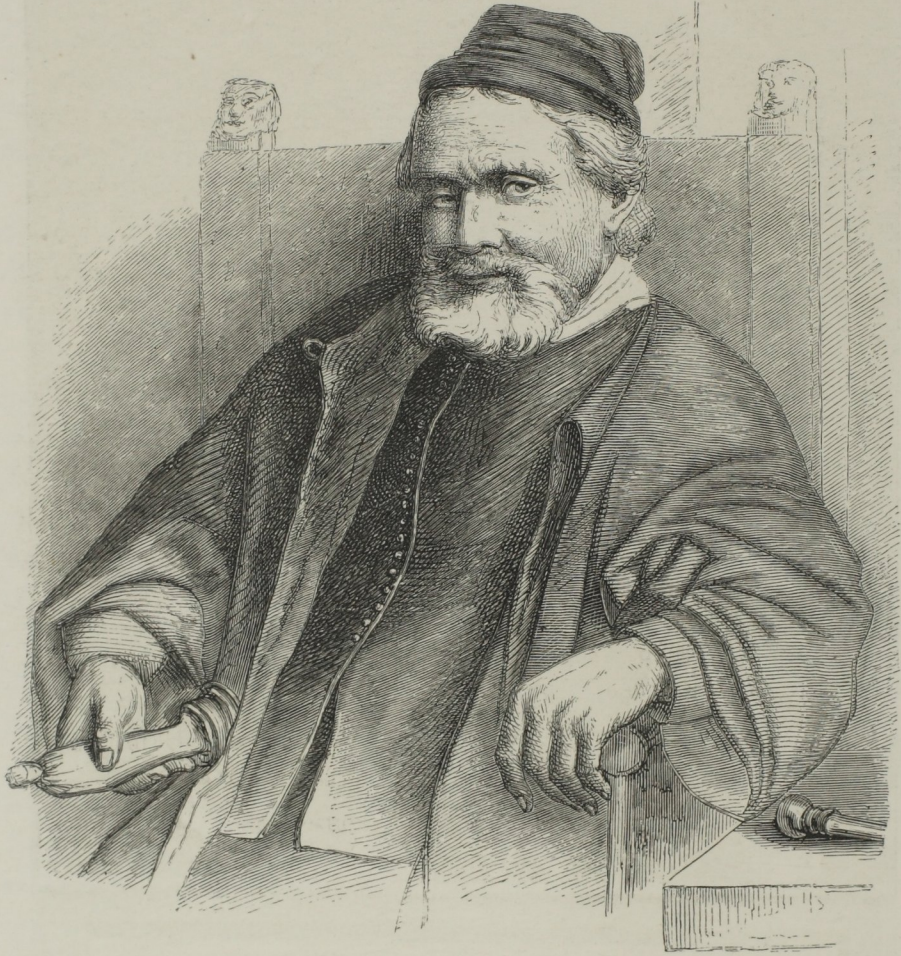
Fig. 272. — Portrait de Jean Lutma, orfèvre de Groningue, dessiné et gravé à l'eau-forte par Rembrandt.

limites qui nous sont prescrites par le cadre même de nos études; mais, comme l'histoire de la gravure ne présente pas, ainsi que plusieurs autres arts, le spectacle d'une affligeante décadence à la suite d'une phase brillante,