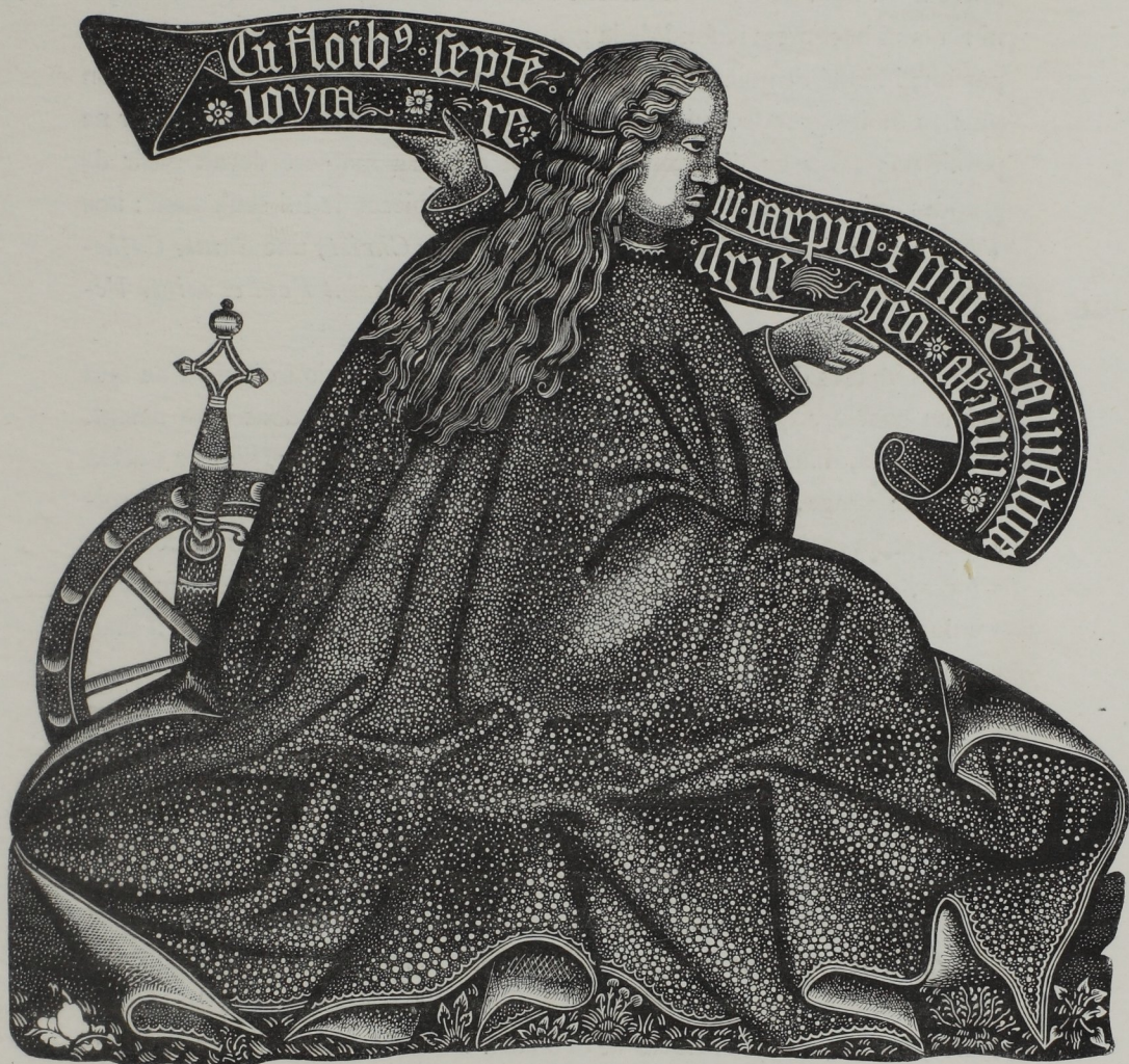
Fig. 263. — Sainte Catherine à genoux, fac-simile d'une gravure sur bois de Bernard Milnet, dit le Maître aux fonds criblés . (Bibl. imp. de Paris. Cab. des est.)

tosjours honoras; saint Jacques le Majeur : Les fiestas et dymeng. garderas, etc.