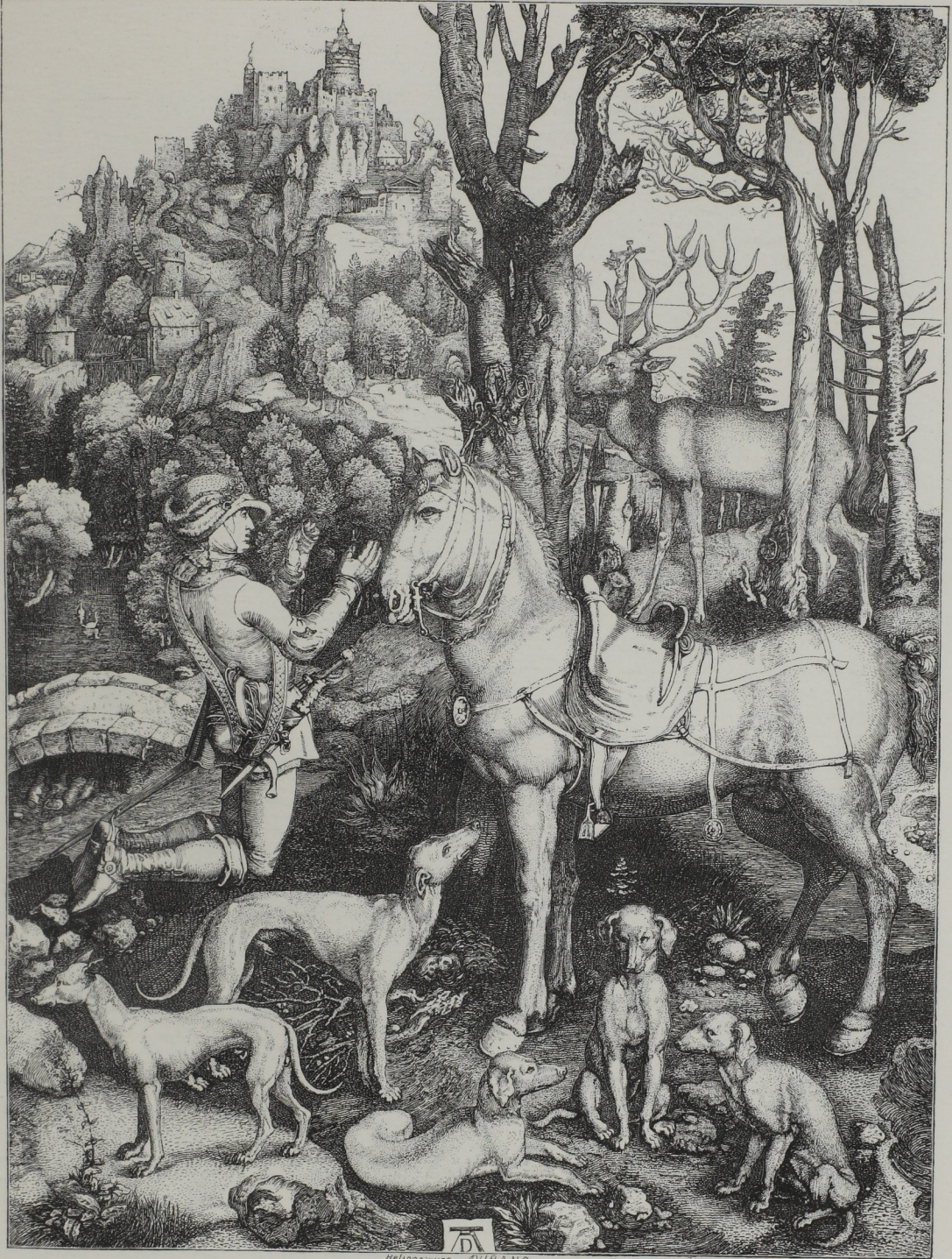
Fig. 269. — Saint Hubert en adoration devant la croix que porte un cerf, gravé par Albert Dürer.