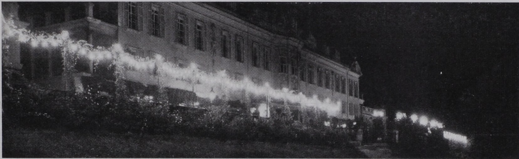
Wirkung bei Beleuchtung