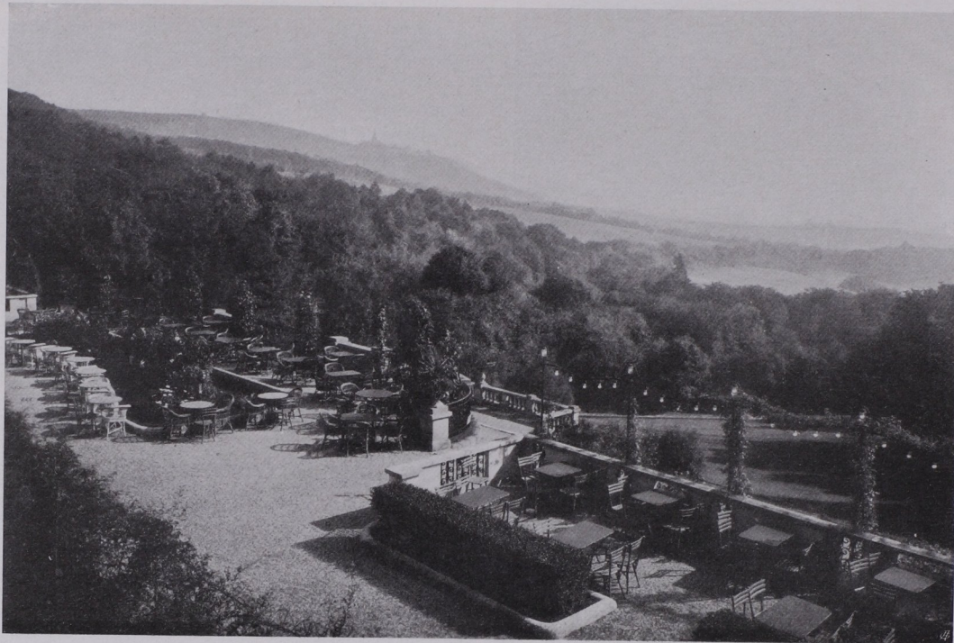
Draufsicht auf einen Teil der Terrasse

Der Vorplatz vor dem als Hotel in Verwendung stehenden, im Wienerwald an einer Berglehne mit Fernblick auf die Stadt Wien und die Donau gelegenen Schlosse „Cobenzl” wurde unter Berücksichtigung der bestandenen, in der Mitte gelegenen, architektonisch ausgebildeten Stiegenanlage durch Schaffung einer Brüstung aus vorhandenem Steinmaterial und Grünstreifen mit Hecken und reichen Schlingrosen-Anpflanzungen zu einer Anlage für einen ausgedehnten Café- und Restaurationsbetrieb ausgestaltet; die für diese langgestreckte, frontal sich entwickelnde Terrasse notwendige Belichtung wurde unter gleichzeitiger Berücksichtigung der Fernwirkung in Form einer Lichtgirlande ausgebildet, welche von eisernen Ständern, die mit der Brüstungsmauer verbunden sind, getragen wird. Dadurch wurde die Belichtungsanlage gleichzeitig in den Dienst der Lichtwerbung gestellt.