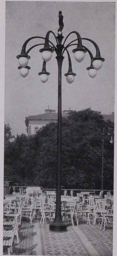
Kandelaber auf der halbkreisrunden Terrasse

Modell der diesen bekrönenden Plastik „Licht“ von Bildhauer Prof. Michael Powolny.