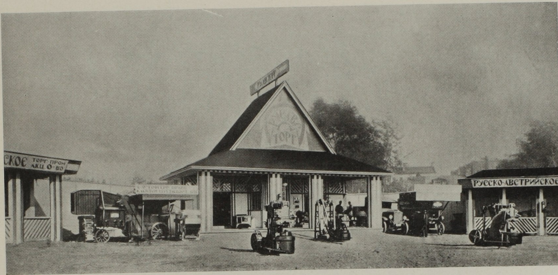
Österreichischer Pavillon auf der Allrussischen Ausstellung in Moskau, 1925