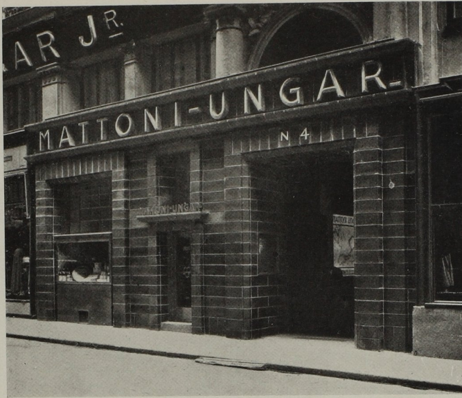
Wien I., Jasomirgottstraße