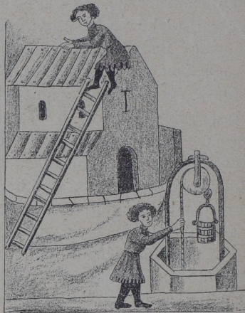
Abb. 2. Prag, Universitätsbibliothek, Cod. VII. C. 8. Bl. 168'.

Das offene Balkenwerk des nur halb eingedeckten Dachstuhles, zu welchem eben ein Zimmermann auf der Leiter emporsteigen will, während ein zweiter noch einen Balken zurecht haut (Abb. 1), wird neben der eben vollendeten Eindeckung des Hauses, welcher eben in Kleinigkeiten nachgeholfen wird (Abb. 2), von Wichtigkeit für die Betriebsart der Eindeckungsarbeiten.