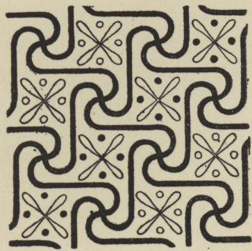
FIG. 5. — Motif de la XX e dynastie (d'après Prisse).

De même que nos modèles nos 38 et 39 correspondaient au quadruple enroulement décrit ci-dessus, ces derniers seraient en rapport direct avec les spirales en S. Le principe est le même, sauf que les courbes sont remplacées par des lignes coudées à angles droits. Ce serait peut-être l'explication la plus naturelle de l'origine de la grecque, et ce qui tendrait à confirmer cette théorie, ce sont les deux panneaux d'un plafond de la XX e dynastie, où nous voyons le même motif traité d'un côté avec des courbes, de l'autre avec des droites (1).