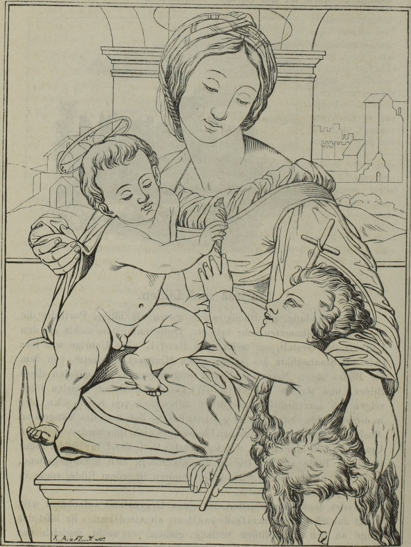
Madonna Aldobrandini von Rafael.

biners. Man lege neben dieses irgend ein ähnlich arrangirtes, nach photographischen Begriffen wohl gelungenes Kinderbild und man wird den ungeheuren Abstand herausfühlen.