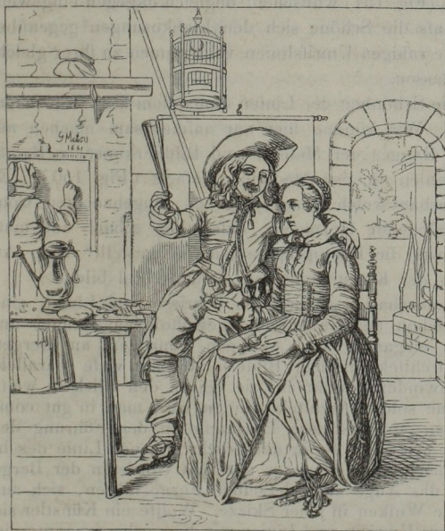
Ein Liebespärcchen von Metz.

Man erkennt hieraus, wie mehrere Umrisslinien ungekünstelt zu einer Hauptlinie zusammenfliessen und selbst das Haar dem Schwunge der Linien folgt.