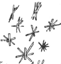
Fig. 10. Allonal-Thallium