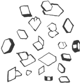
Fig. 12. Dial-Kupfer-Ammoniak