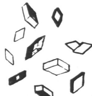
Fig. 9. Veronal-Thallium Propional-Thallium