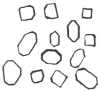
Fig. 8. Sandoptal