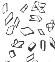
Fig. 13. Baronal-Kupfer-Ammoniak