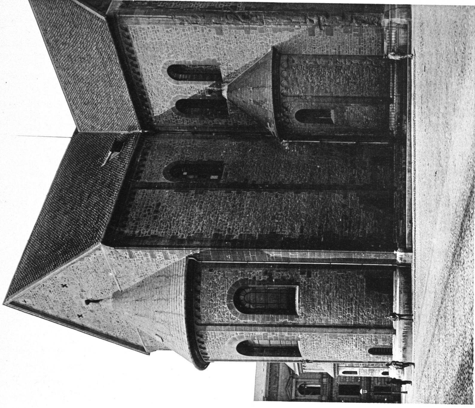
HUGO HARTUNG HERAUSGEG.