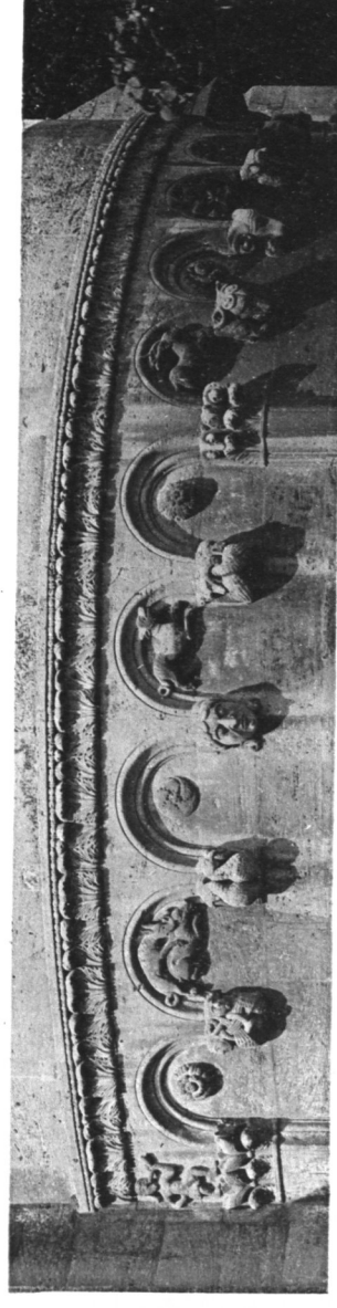
LICHTDRUCK VON ROEMMLER & JONAS DRESDEN