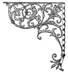
Balcon-Consolen aus der Eisen-Constructi- ons- und Kunstschmiede-Werkstatt von Ed. Puls zu Berlin. — \frac{1}{50} n. Gr.