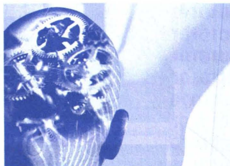
Förderpreis für gesellschaftlich relevante Forschungsprojekte.

Die Einreichungen werden dann zunächst von der TU Graz auf ihre grundsätzliche Eignung geprüft – für den Förderpreis ungeeignete Einreichungen werden vorab ausgeschieden. Danach beurteilt eine Jury, bestehend aus drei Vertreterinnen und Vertretern des Forums Technik und Gesellschaft sowie drei der TU Graz und aus der Medienbranche, die abgegebenen Argumentationen zu den geeigneten Arbeiten in zwei Stufen und ermittelt so die Preisträgerinnen und Preisträger. Einreichungen sind bis inklusive 15. September möglich. ■