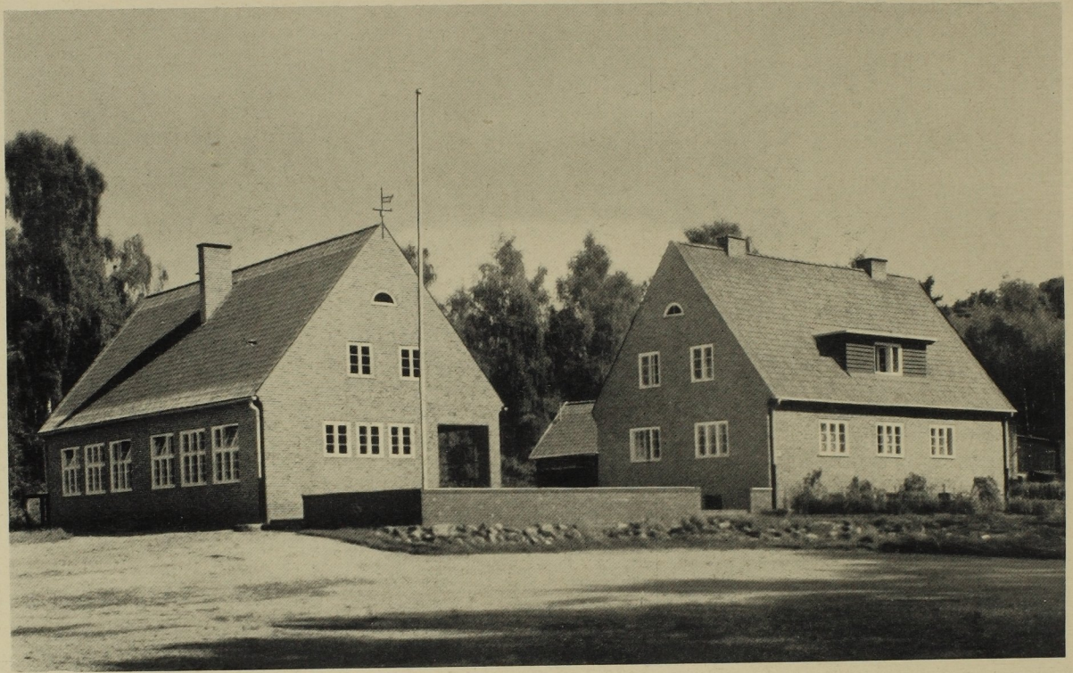
Zweiklassige Schule in Kahlberg, Regierungsbezirk Marienwerder. Architekt: Preußische Staatshochbauverwaltung. Ansicht von Südwesten. Äußere Wandflächen aus Hartbrandsteinen, vermischt mit Buntklinkern, weiß gefügt.

Schulgebäude, Wohngebäude und Wirtschaftsgebäude sind in besonderen Baukörpern getrennt und um einen Hof gruppiert. Wohngebäude und Schulgebäude sind durch Terrasse und Mauer zusammengebunden. Im Dach befindet sich eine gut belichtete Lehrküche. In dem einen Klassenraume ist ein abzublendendes hohes Rückenlicht zur Verstärkung des Seitenlichtes angeordnet.