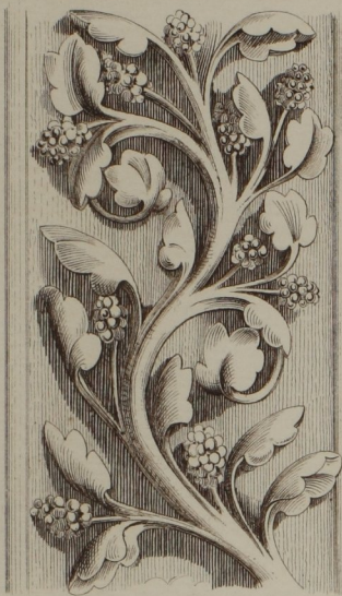
Frühgotische Ranke. (Notre dame in Paris) XIII Jahrhundert (n. Viollet-Le Dux)