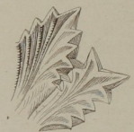
Fig. 6 a Griechische Akanthusblattparthie. (n. G. Schreiber)