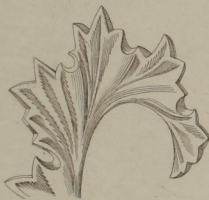
Fig. 5 a Griechische Akanthusblattparthie. (n. G. Schreiber)