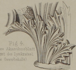
Fig. 4. Griechisches Akanthusblatt (v. Monument des Lysikrates). (n. C. Uhde Gewerbehalle)