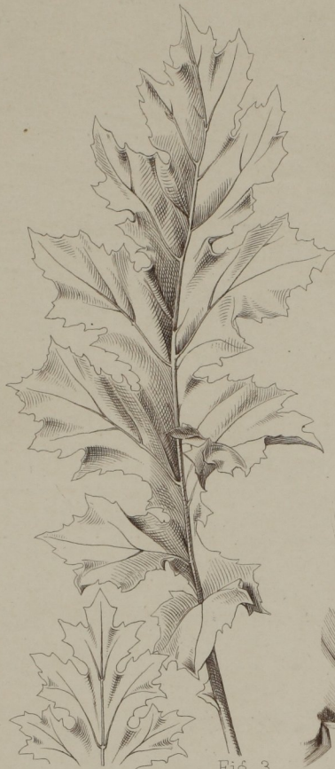
Fig. 3. Akanthusblatt n. d. Natur (v. C. Uhde).