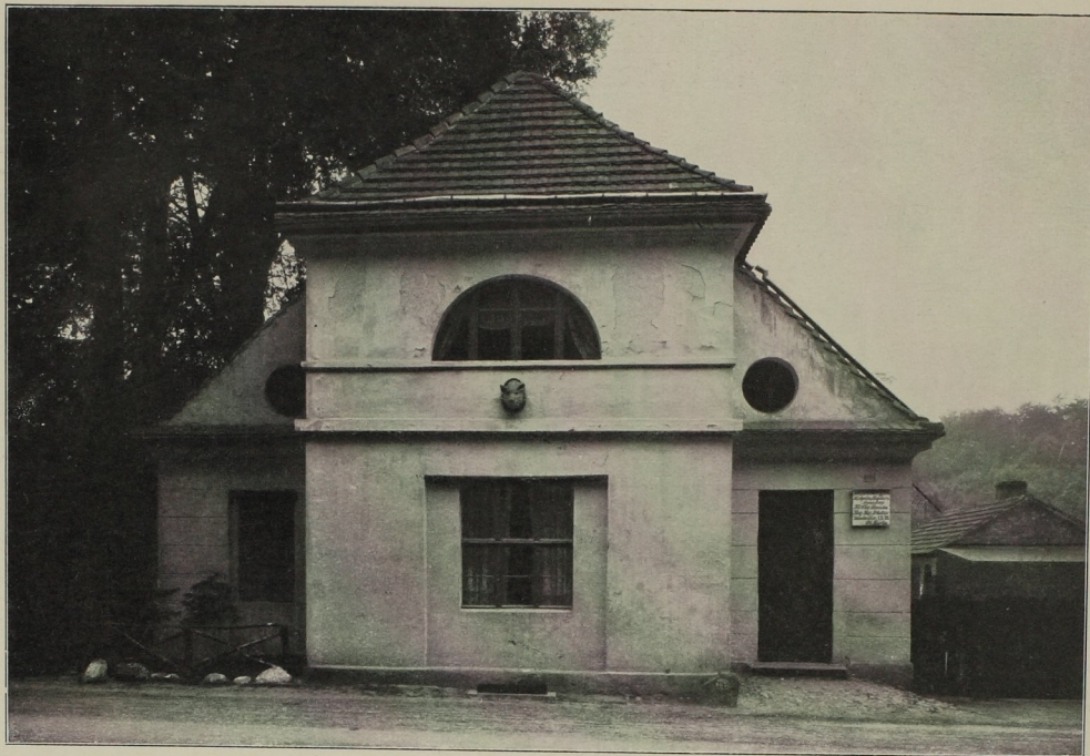
Chausseehaus an der Straße von Berlin nach Freienwalde. 1805