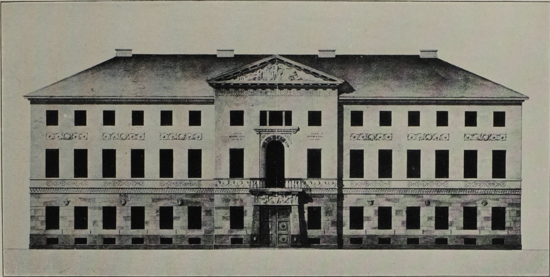
Peter Jos. Krahe. Aufriß zum v. Veltheimschen Hause in Braunschweig. Um 1803