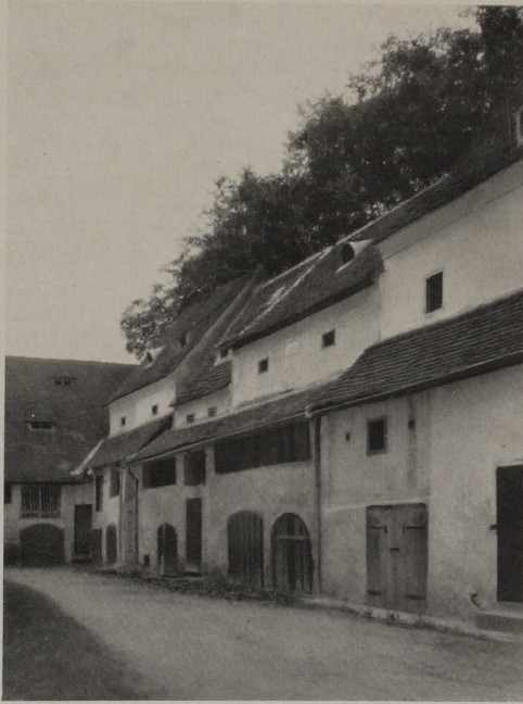
Abb. 46. Feldbach, der Tabor, Innenseite

seinerzeit der Graben noch verstärkt haben mag. Nur kleine, schießchartenähnliche Öffnungen unterbrechen die massive Außenwand. Da die Belichtung der auf zwei Geschosse verteilten Aufenthaltsräume infolgedessen nur einseitig erfolgen konnte, mußten sie eintraktig angeordnet werden. Die Obergeschosse waren daher wenig tief. Sie wurden durch vorgelagerte Laubengänge erweitert (Abb. 46).