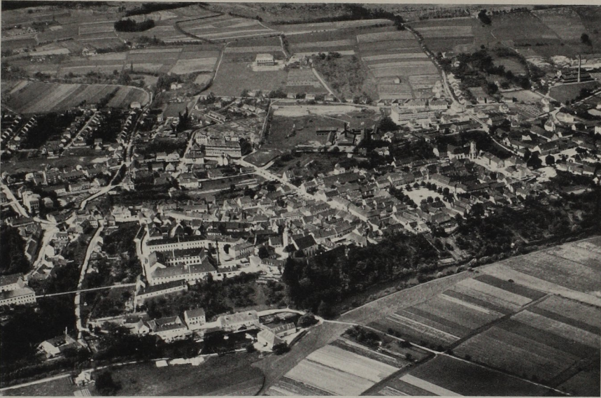
Abb. 22. Fürstenfeld

Eine Ausbreitung über den mittelalterlichen Gebietsumfang hinaus erfuhr Fürstenfeld im XVI. Jahrhundert im Nordwesten durch den Ausbau der Grazer Vorstadt 1 . Sie lag jenseits des Grabens und stand mit der Stadt durch die Brücke vor dem Grazer Tor in Verbindung. Trotzdem sie gleichfalls befestigt war, wurde sie im Jahre 1663, angesichts der besonderen Türkengefahr, zur Besserung der Verteidigungs-