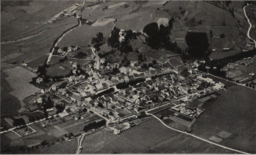
Abb. 18. Neumarkt

erheblichen Niveauunterschiede innerhalb der Siedlungsstelle machten die Entfaltung des Normal-schemas einer Stadt mit durchgehendem Straßenmarkt unmöglich. Der besonders betonte Gelände-vorsprung, auf welchem die Kirche zu stehen kam, und der Geländeabbruch im Norden ließen knapp Raum für den Markt und die beiden ihn begleitenden Hofstättenzeilen. Die Umrisslinie der Stadt fiel daher im Norden, ähnlich wie in „beschlusenen“ Märkten, mit den hinteren Hofstättengrenzen unmittelbar zu-sammen. Nur südlich des Marktes waren der Anlage weitere Entfaltungsmöglichkeiten gegeben. Die Umrisslinie paßte sich hier den bewegten Geländeformen an, die damit zwangsläufig die irreguläre Form der Freiflächen bestimmten.