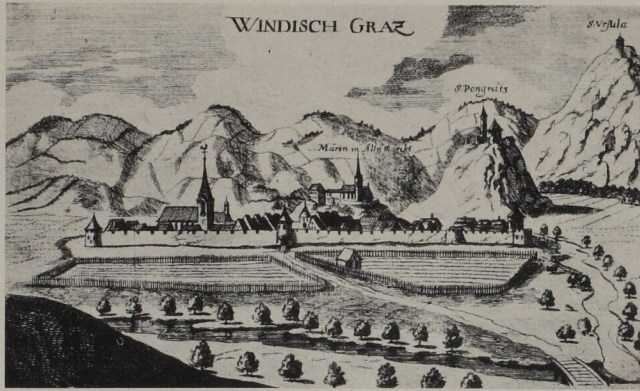
Abb. 15. G. M. Vischer, Stadt Windisch-Graz um 1680

Nur im Westen, wo die genannte Erhebung an den Bachrändern nicht unbeträchtlich abfällt, waren geringe Konzessionen an die Geländeform notwendig. Der Marktplatz ist nicht rechteckig, sondern gegen die Tore konisch verjüngt.