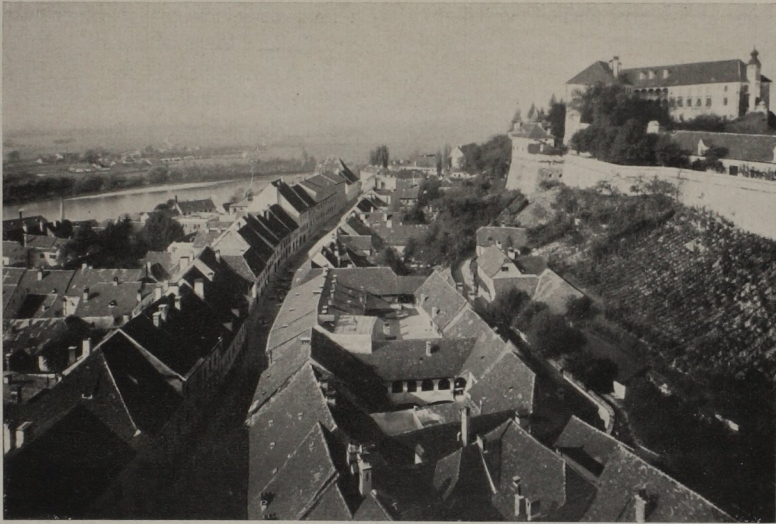
Abb. 4. Pettau, Herrengasse (Prešernova ulica), die Marktstraße der alten Handelsniederlassung

unter 10 m deutlich erkennbar ist, ebenso in Neumarkt (besonders in der westlichen Zeile) und im südlichen Teile von Rann: rund 10 m (30 Fuß). In Graz lassen sich dreierlei Breitenmaße nachweisen, die in einzelnen räumlich begrenzten Teilen des Kernes der Altstadt einheitlich gereiht auftreten. Die schmalsten Hofstätten (wenig unter 10 m) liegen an den beiden Langseiten des Marktes und am Eingang in die Sackstraße. Im Sack schließen daran rund 11·5 m breite an und die breitesten (rund 14 m) liegen in der Herrengasse.