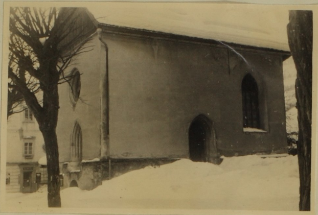
21, Die Annakapelle,