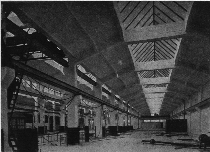
Abb. 1254. Conz Electricitäts-Gesellschaft, Inneres der Halle.

Vorgänge farb- und geruchlos gemacht wird, ehe es der Margarinefabrik zugeführt werden kann. Das bei der Extraktion entölte Restprodukt wird gedarrt und im Schrottspeicher bis auf Abruf zur Verwendung als Viehfutter gelagert. Bautechnisch sind sowohl bei dem Speicher, als auch bei der Ölfabrik dieselben Grundsätze und Ausführungsweisen wie bei der Margarine-