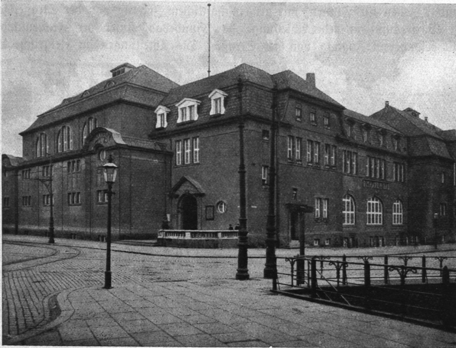
Abb. 1121. Bismarckbad.

Im zweiten Obergeschoß eine Wannensbadabteilung für Männer mit 18 Bidezellen, außerdem eine Wohnung für den Obermaschinisten.