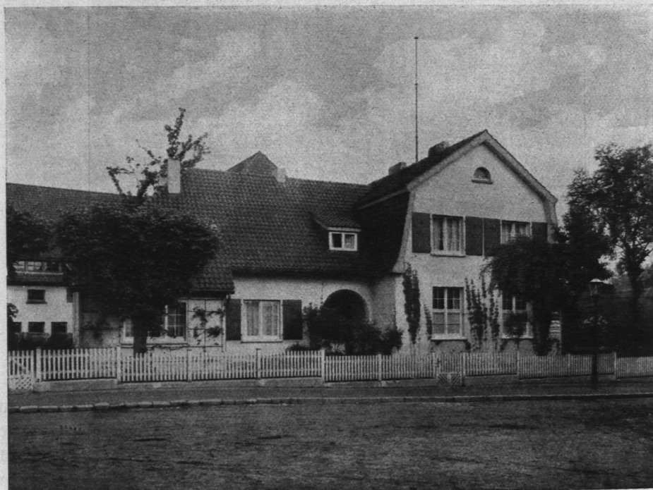
Abb. 1107. Polizeiwache Hirtenweg.

Die Hauptpost ist in den Jahren 1892 bis 1894 nach den im Reichspostamt aufgestellten Plänen unter Oberleitung des Geheimen Baurats Schuppan erbaut. (Abb. 1110 und 1111.) Die Gesamtbau summe betrug rund 720000 Mark. Das Hauptgebäude enthält die Betriebsräume für den Post-, Telegraphen- und Fernsprechtbetrieb und vier Dienstwohnungen. Das besondere Telegraphenamt ist im Jahre 1906 aufgehoben worden. Die in den Formen der deutschen Renaissance ausgeführte Schauseite zeichnet sich durch reiche Sandsteingliederung in ziegelverblendeten Flächen aus. In der Mitte erhebt sich ein viereckiger Turm, der auf seiner Plattform einen eisernen Aufbau für die Fernsprechleitungen trägt.