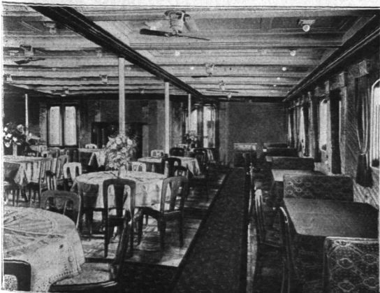
Abb. 1030. „Tabora“, Speisesaal.

In enger Fühlung mit der Woermann-Linie steht die 1890 mit einem Aktienkapital von 6 Millionen Mark gegründete Deutsche Ost-Afrika-Linie. Zurzeit beträgt das Aktienkapital 10 Millionen Mark, außerdem bezieht sie als einzige der Hamburger Reedereien eine jährliche staatliche Unterstützung von 1300000 Mark. 26 Seedampfer von zusammen etwa 123000 Brutto-Registertonnen, 10 Schleppdampfer, Leichter usw. von zusammen 2336 Brutto-Registertonnen bilden die Flotte der Gesellschaft, womit sie gemeinschaftlich mit der Woermann-Linie und der Hamburg-Amerika Linie zweimal monatliche Fahrten im Reichspostdienst östlich und westlich rund um Afrika sowie je eine Frachtlinie von Hamburg durch den Atlantik, bzw. durch den Suezkanal nach Südafrika, eine Küstenlinie und eine Linie Bombay—Südoafrika unterhält. Als Beispiel der hochwertigen Reichspostdampfer sei „Tabora“, bei Blohm & Voß in Hamburg 1912 erbaut, genannt. (Abb. 1029.) Das Fahrzeug ist 136,96 m lang, 16,55 m breit, vermisst 8022 Brutto-Registertonnen und läuft 13 Knoten bei einer Maschinenkraft