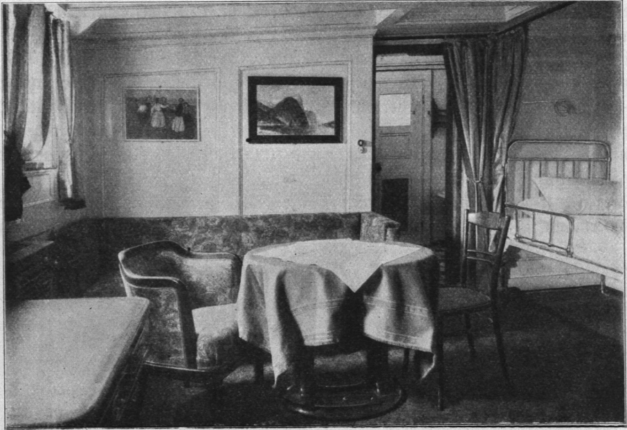
Abb. 1027. „Professor Woermann“, Wohn- und Schlafzimmer erster Klasse.

Eisenbahnen in den deutschen und fremden Kolonien und die dadurch bedingte wirtschaftliche Erschließung des Landes vollständig anders geworden. In der Kamerun-(Togo-) Hauptlinie, die zweimal monatlich befahren wird, laufen seit langem erstklassige Schiffe, die wegen der eigenartigen Küstenverhältnisse Westafrikas nicht allzu groß sein und nicht sehr tief gehen dürfen. Als Beispiel ist das jüngste dieser Schiffe, der „Professor Woermann“ (Abb. 1026), im Bilde wiedergegeben.