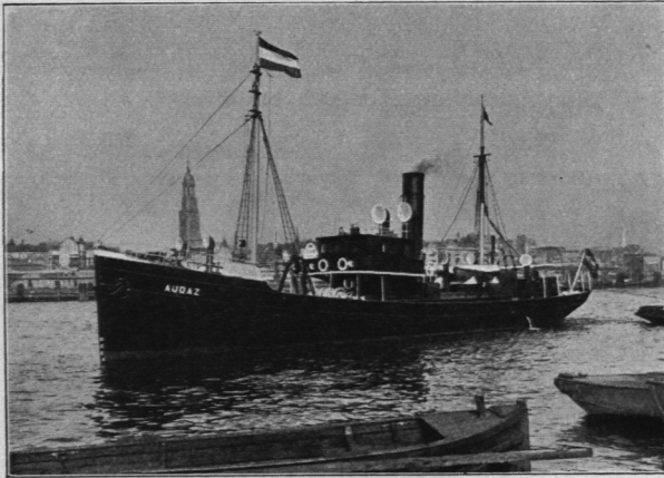
Abb. 994. Schiffswerft H. C. Stülcken Sohn, Fischdampfer „Audaž“.