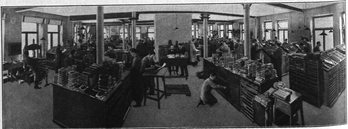
Abb. 974. H. D. Perfiel, Sezerjaal.

Der weitaus bedeutendste Geschäftszweig, die Anstalt für Buch- und Kunstdruck, befindet sich in dem an drei Seiten freiliegenden und daher durch vorzügliche Lichtverhältnisse ausgezeichneten Gutenberg-Hause an der Katharinenbrücke (Abb. 972), das eine Grundfläche von 400 qm bedeckt. Es werden hier Drucksachen jeder Art, besonders Akzidenz- und Werkdruck, hergestellt, wobei die neuen Illustrationsverfahren, der Autotypiedruck, die Duplexautotypie, der mehrfarbige