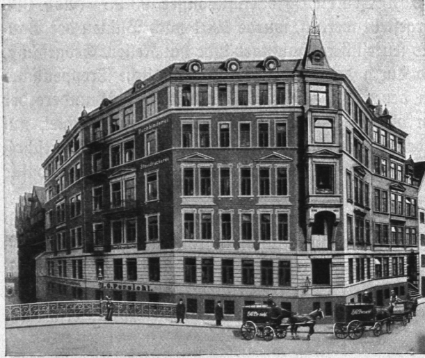
Abb. 972. H. D. Perfiel, Gutenberg-Haus.