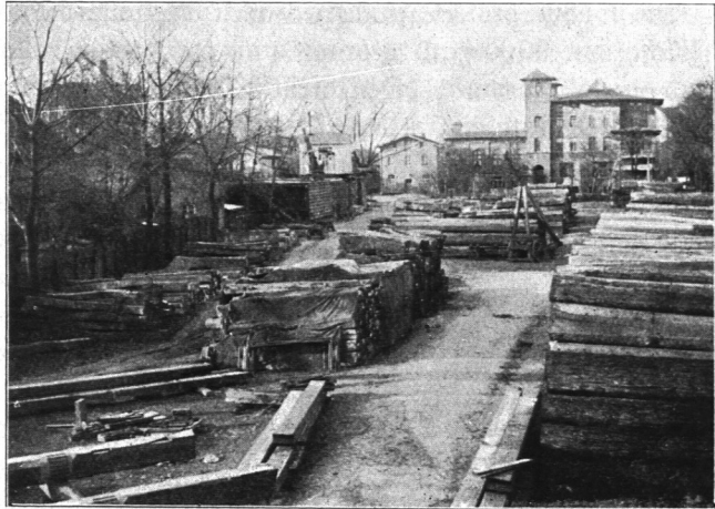
Abb. 945. J. F. Müller & Sohn, Teil des Mahagoniholzlagers.

Der von jeher in Hamburg bedeutende Handel mit überseeischen Holzarten hat die Gründung des Allgemeinen Mahagoniholzlagers, Vierländerstraße 300, im Gefolge gehabt, das von der seit 1795 bestehenden größten Maklerfirma in ausländischen Hölzern, J. F. Müller & Sohn, unterhalten wird. Die Firma gründete zuerst 1831 auf dem Grasbrook einen Lagerplatz, auf dem die hereinkommenden Warenmengen, hauptsächlich Domingo-Mahagoni und Brasil-Jakaranda, auch Zedernholz, gestapelt wurden. Nach und nach mußten andere Plätze hinzugenommen werden, und 1868 erwarb J. F. Müller, um die getrennten Betriebe wieder zu vereinigen und um auf Jahrzehnte den Ansprüchen des Handels in seinen Hölzern zu genügen, ein Grundstück am Ausschläger Elbdeich, das aufgehöhht und zunächst mit einem einfachen Handkran am Deich versehen wurde. 1873 wurde eine bessere Brücken- und Dampfkranlage geschaffen; bald wurden auch Lager-schuppen, 1886 der erste eiserne Schuppen durch die Brückenbauanstalt Gustavsburg erbaut.