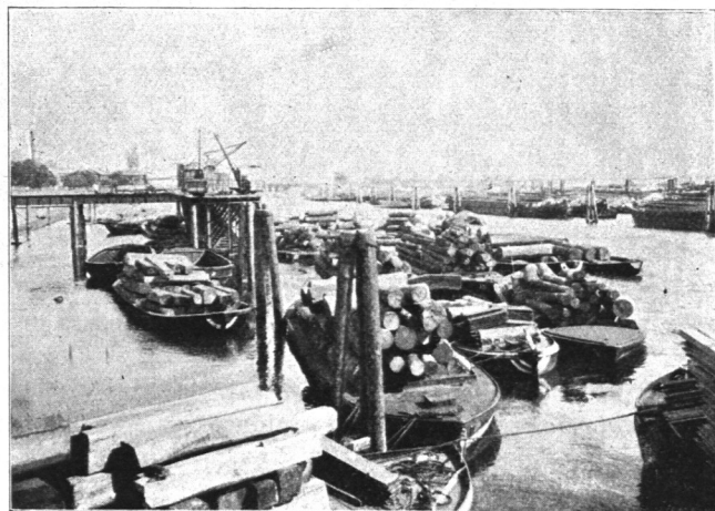
Abb. 947. J. F. Müller & Sohn, Ladebrücken an der Elbe.