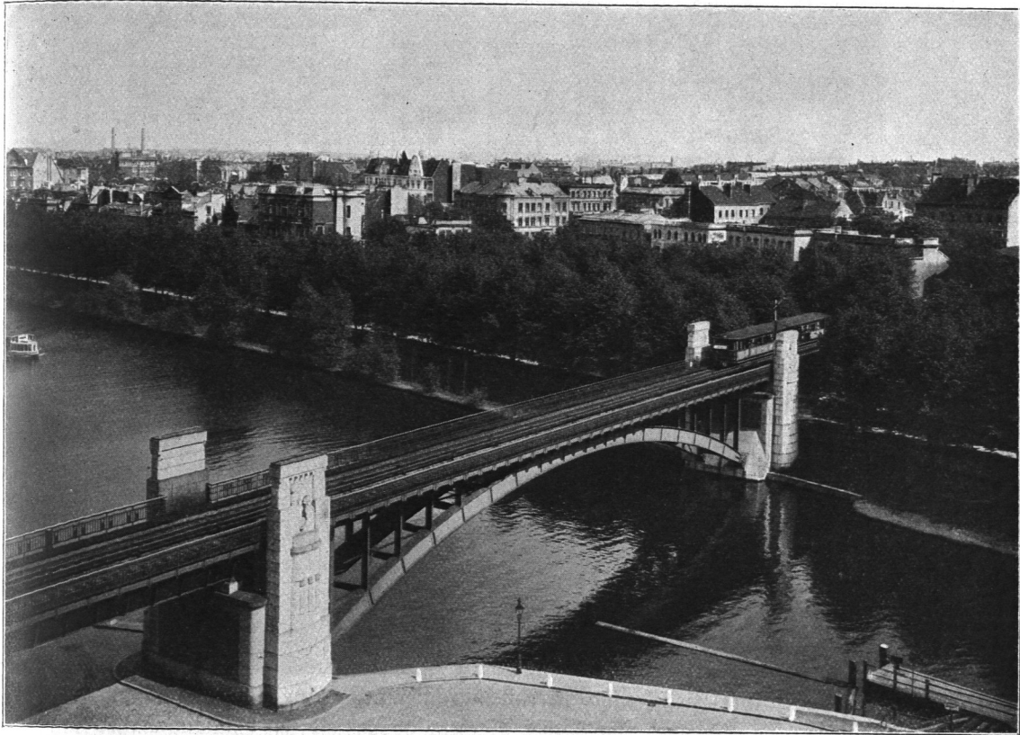
Abb. 823. Brücke über den Ruhmühlenteich.