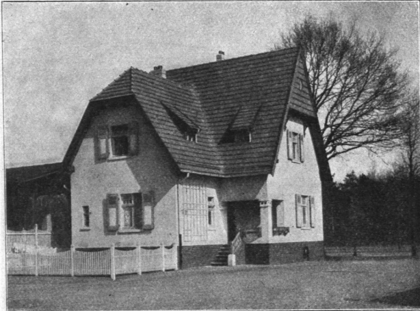
Abb. 812. Haltestelle Dhlisdorf, Wohngebäude.

Dieser Bahnhof, der zurzeit ausschließlich dem Verkehr der Hasselbrook-Dhlisdorfer Bahn dient, wird in Kürze noch den Verkehr der weiter unten behandelten Hochbahn und der Langenhorner Bahn aufzunehmen haben und er wird damit in die Reihe der sehr starkbelasteten Bahnhöfe eintreten. Ein geräumiger Vorplatz vermittelt den Übergang der Reisenden von der Straße in die Eingangshalle des Stationsgebäudes, neben der links und rechts die Betriebsräume und die Aborte gelegen sind. Aus