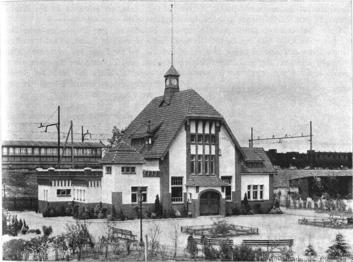
Abb. 810. Haltestelle Döhlendorf, Bahnhofsgebäude.